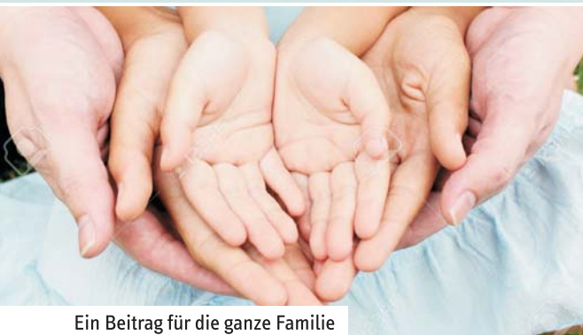
Ein Beitrag für die ganze Familie